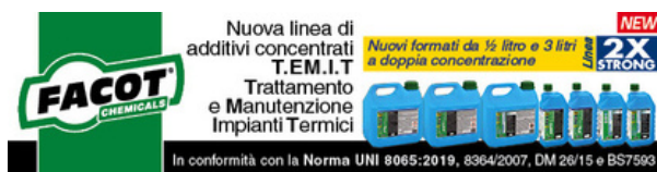
Banner 600 x 150