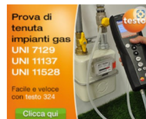
Banner 250 x 250